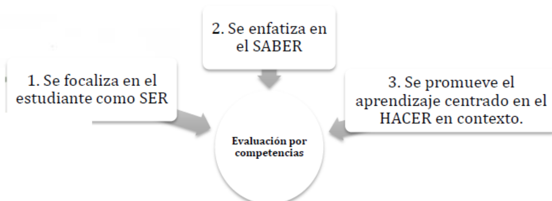
Ilustración 2 Evaluación por competencias, refleja las competencias evaluadas en la IE ASIA IGNACIANA.

entre otras, estas competencias se relacionan con el HACER, demostrado en las acciones, actos y productos que cada estudiante demuestra y da a conocer a su docente con el fin de observar su progreso en el aprendizaje para la vida.