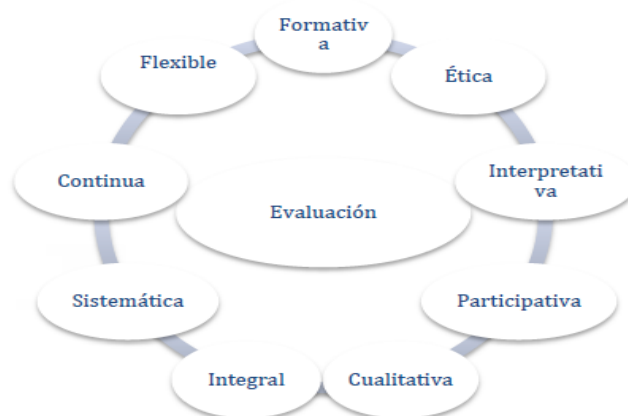
Ilustración 1. Características de la evaluación.

Ilustración 1 Características de la evaluación